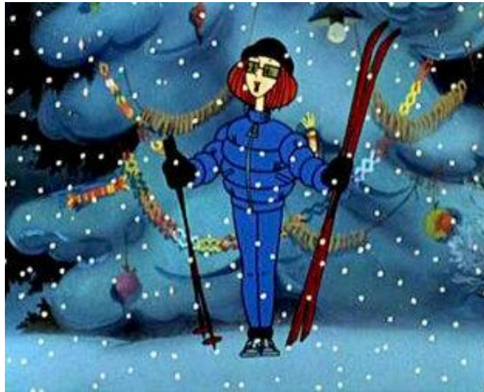
Кадр из м/ф «Зима в Простоквашино» (1984 г.)

5. Послушай песню «Кабы не было зимы...» в исполнении Валентины Толкуновой и попробуй напеть её сам(а). Композицию можно прослушать по ссылке https://music.yandex.ru/album/4644677/track/36812772