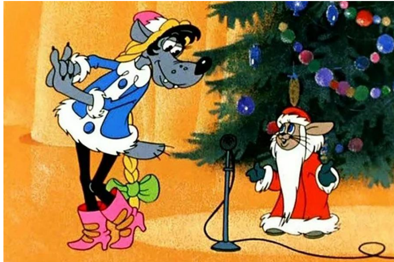
Кадр из м/ф «Ну, погоди!» (выпуск №8, 1974 г.)

https://music.yandex.ru/album/670785/track/6098477